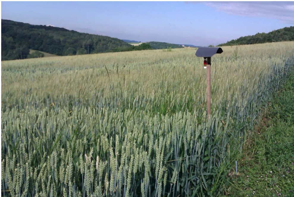
Der WW-Intensivierungsversuch Pyhra Ende Juni 2014:

Aus der mehrjährigen Betrachtung ist erkennbar, dass ein Versorgungsniveau von bis zu 160 kg N/ha in jedem Fall als wirtschaftlich erscheint - abgesichert nicht nur durch höhere Erträge sondern auch durch bessere Qualitäten. Bei mehr als 160 kg N/ha ist der Mehrertrag unsicher. Der Mehraufwand kann hier eher über den verbesserten Proteingehalt und die damit höheren Verkaufspreise abgedeckt werden.